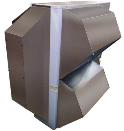
外観写真 (※変更品 AGJS-28FB1S1 装着時)

平素は当社製品に対し格別のご愛顧を賜わり厚く御礼申し上げます。 今般、三菱電機スリムエアコン室外ユニット対応防雪フードにおいて、 防雪性能向上のため一部形状を変更させていただきますので下記のとおりご連絡いたします。ご確認お願いいたします。