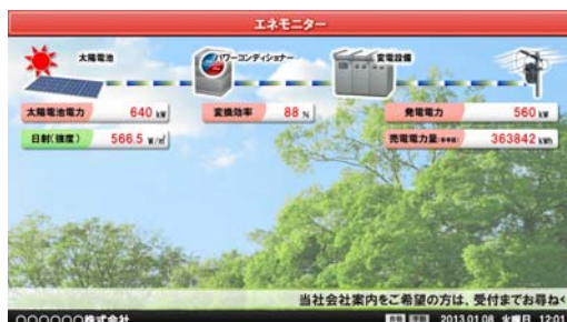
エネモニター画面