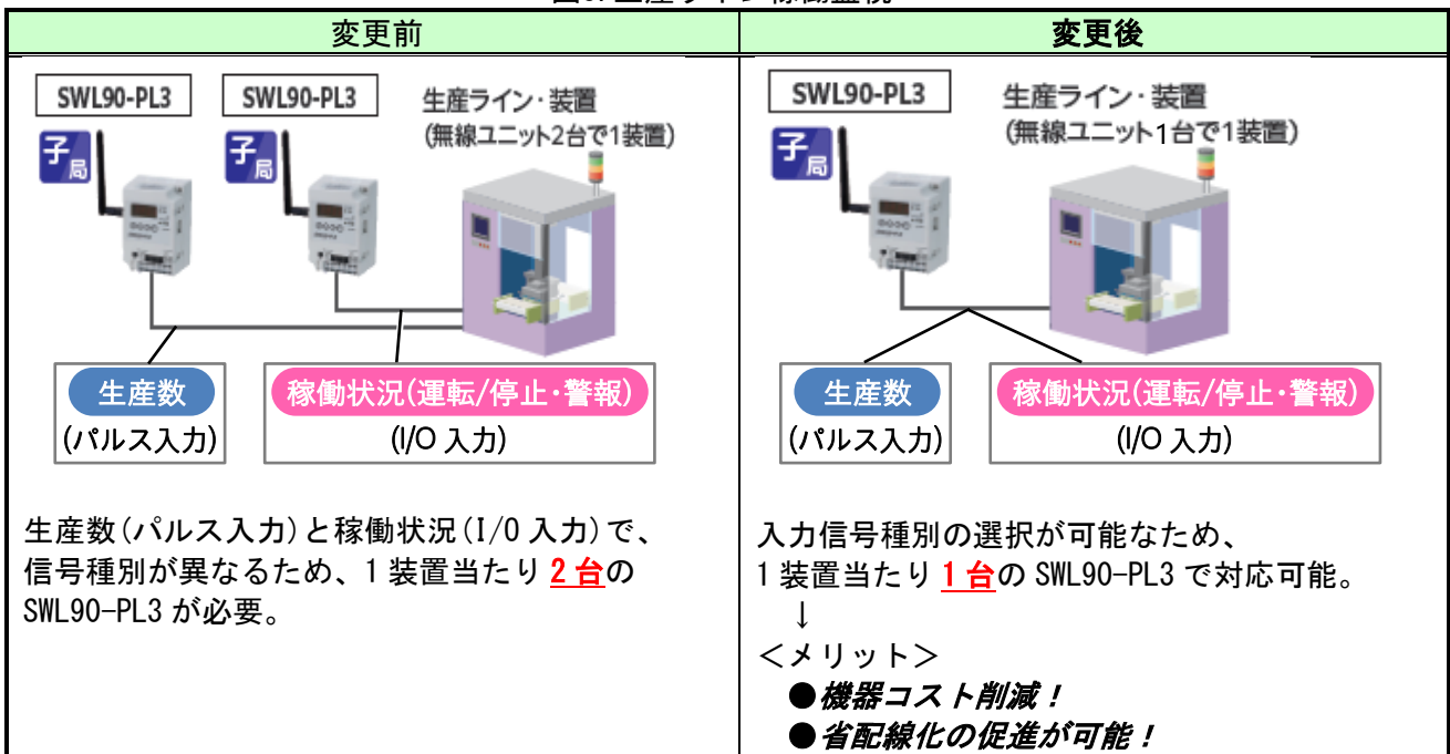
図3. 生産ライン稼働監視