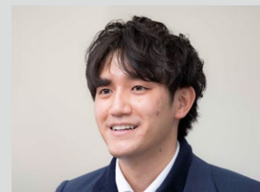
コニカミノルタ株式会社 QOLソリューション事業部 カスタマーエンゲージメント部 CSX統括グループ

「コロナ禍で介護施設のお客様先に訪問できなくなりオンライン商談を開始しましたが、既存のWeb会議ツールでは、お客様施設での活用イメージをうまく訴求することができず、苦戦しました。そのため、Webセミナーやオンラインデモの実施、動画コンテンツの内製化など、営業DXのための具体的な実現方法の検討を開始しました。我々のお客様は介護施設という仕事柄、対人コミュニケーションをととても重視されます。ですので、オンラインでのコミュニケーションの質は対面と同等、もしくはそれ以上のレベルが求められました。」